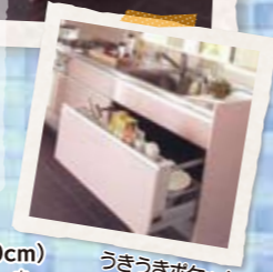
うきうきポケット

アイエック クリンレディ(間口2570cm) キッチン部定価1,216,530円(税込)を