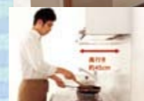
背の高い方もフードを気にせず作業できます

Panasonic リビングステーションSクラスキッチン (間口2570cm)キッチン部定価1,980,000円(税込)を