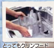
とつてもクリンフード